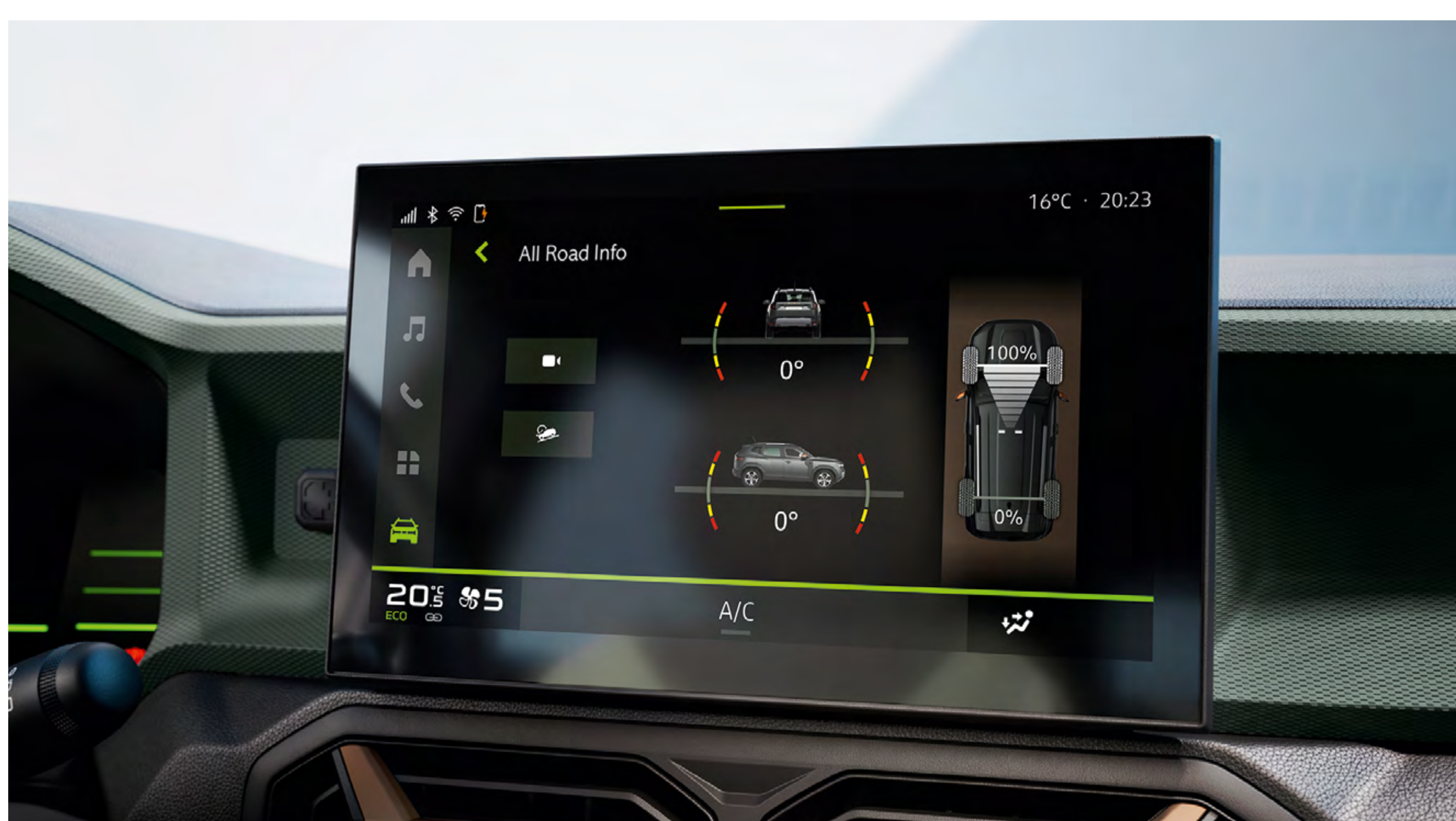
Touchscreen mit Höhenmesser

Im neuen Dacia Duster mit Allradantrieb kann Sie nichts aufhalten: Seine per Drehregler wählbaren Fahrmodi bringen Sie unter allen Bedingungen sicher weiter. Seine Bodenfreiheit von bis zu 217 mm und ein Böschungswinkel von bis zu 31° machen ihn extrem geländegängig. Dank Allradantrieb meistern Sie auch schwieriges Terrain, Bauteile aus kratzfestem Starkle® schützen dabei wichtige Karosserieteile.