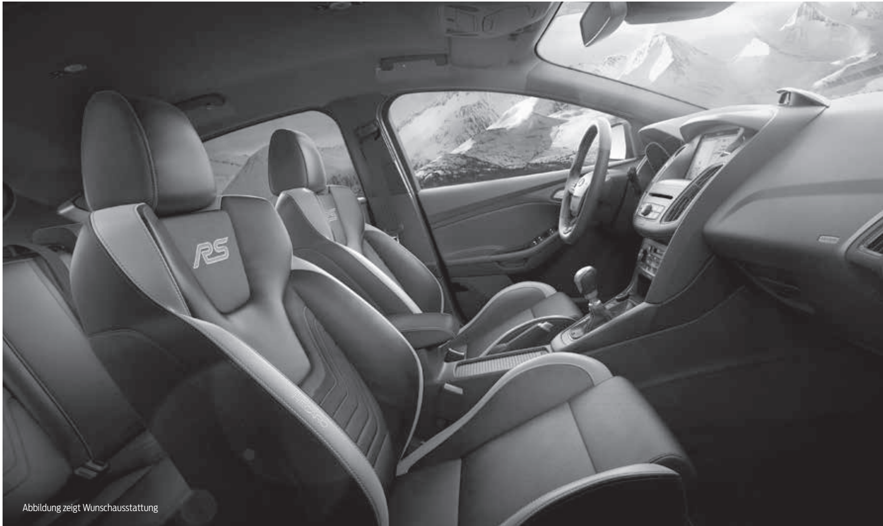
Abbildung zeigt Wunschausstattung