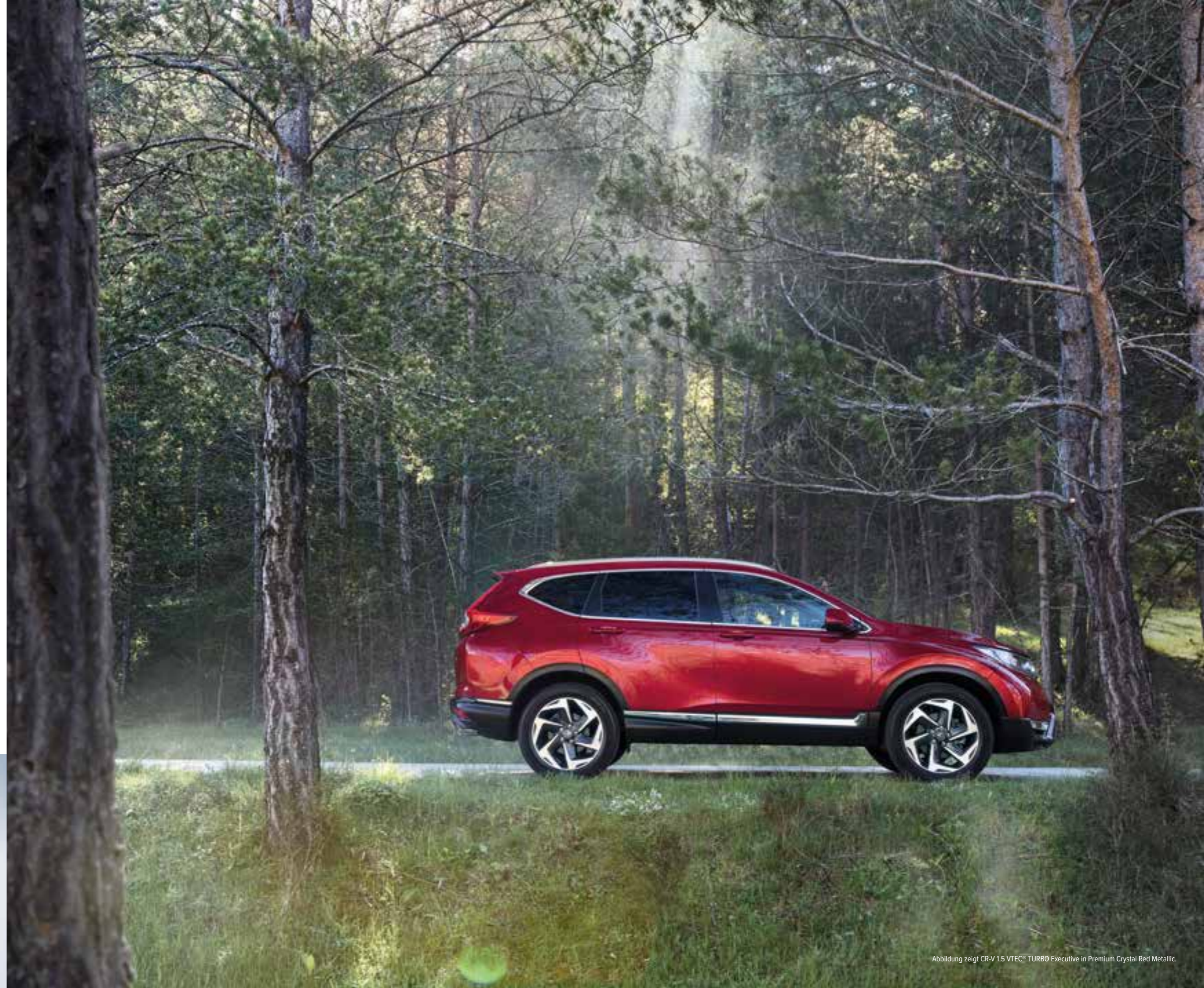
Abbildung zeigt CR-V 1.5 VTEC® TURBO Executive in Premium Crystal Red Metallic.