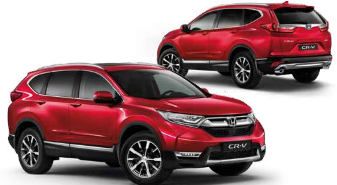
Abb. zeigen 19"-Leichtmetallfelgen CR1901.

Hinweis: Optional können die vier Sensoren für die hintere Stoßstange, die serienmäßig schwarz/anthrazit sind, in Wagenfarbe bestellt werden.