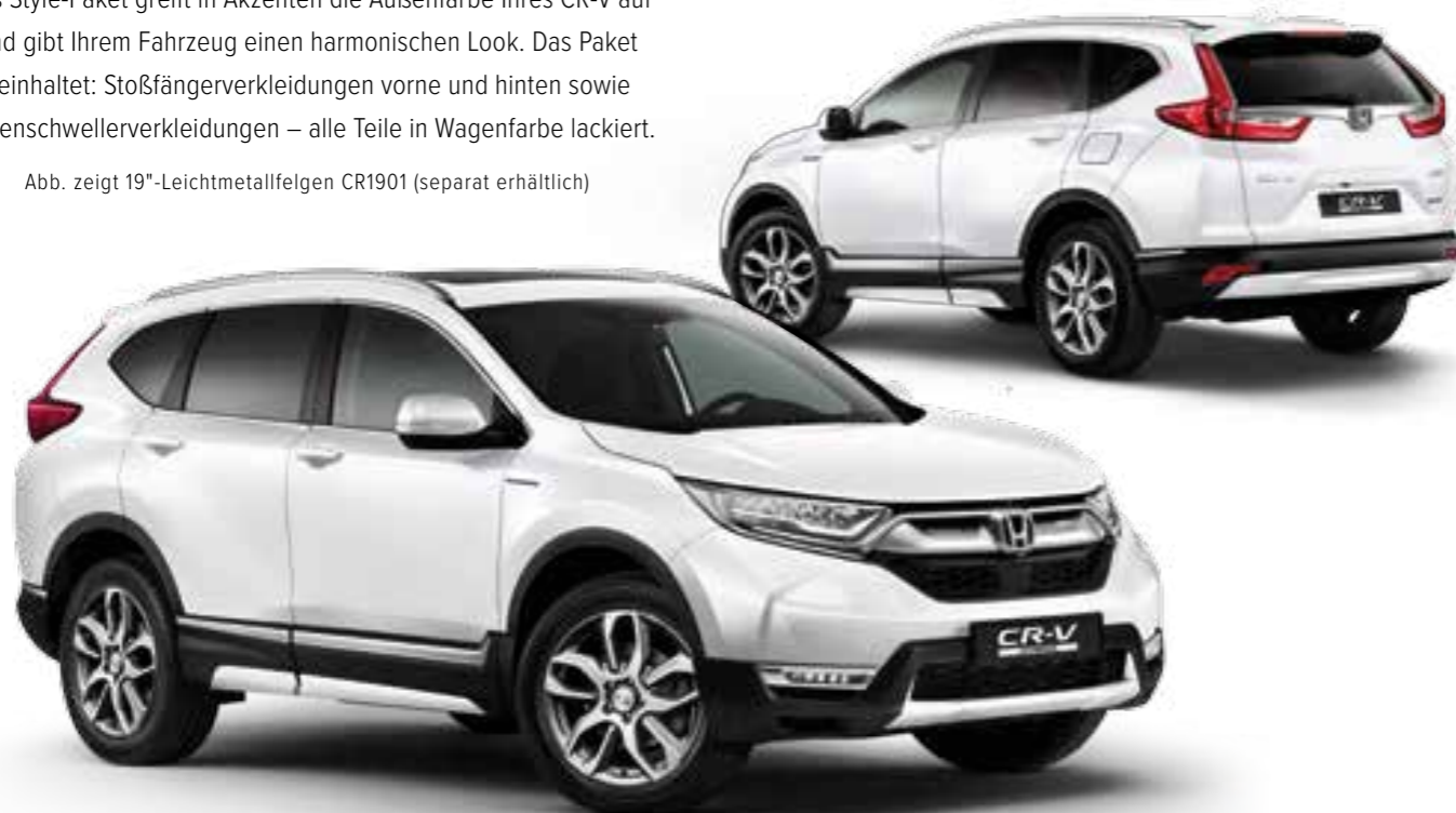
Abb. zeigt 19"-Leichtmetallfelgen CR1901 (separat erhältlich)

Das Style-Paket greift in Akzenten die Außenfarbe Ihres CR-V auf und gibt Ihrem Fahrzeug einen harmonischen Look. Das Paket beinhaltet: Stoßfängerverkleidungen vorne und hinten sowie Seitenschwellerverkleidungen – alle Teile in Wagenfarbe lackiert.