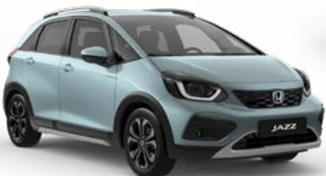
Fjord Mist Pearl