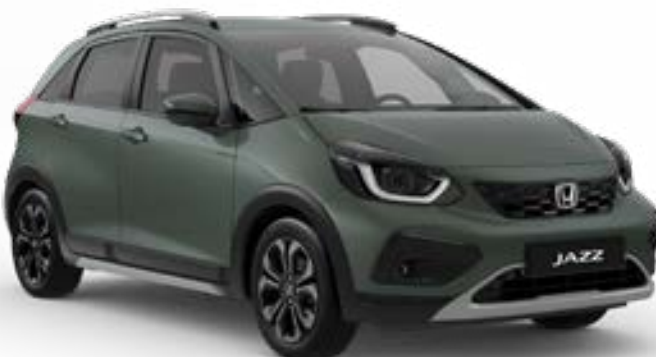
Sage Green Pearl