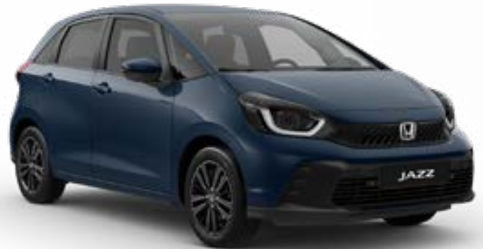
Seabed Blue Pearl