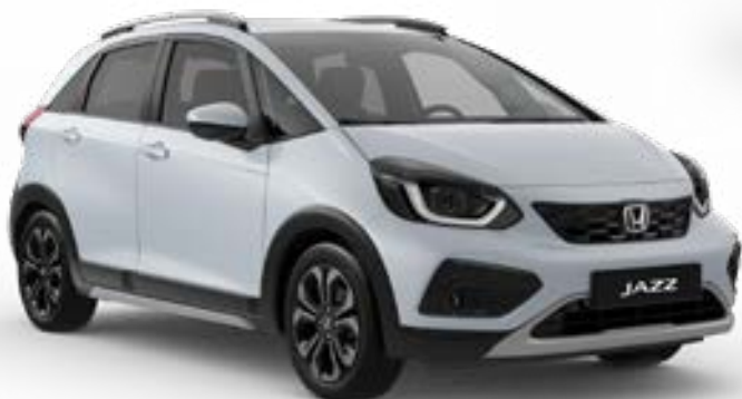
Premium Sunlight White Pearl