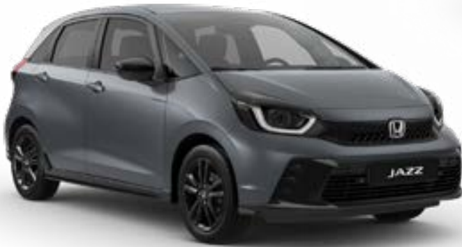
Urban Grey Pearl

Wir haben eine breite Palette an Farben kreiert, die perfekt zum stilvollen Jazz und zu Ihrem Lifestyle passen.