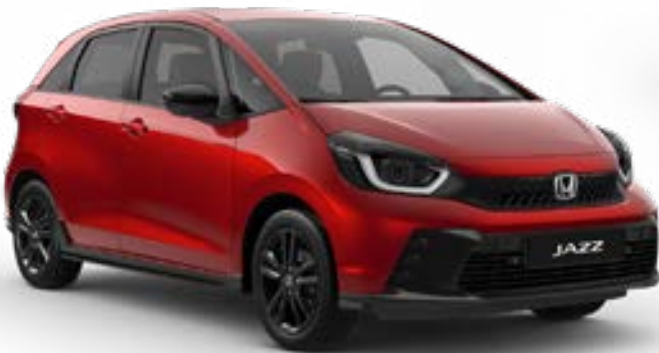
Premium Crystal Red Metallic