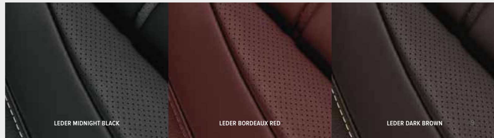
LEDER MIDNIGHT BLACK