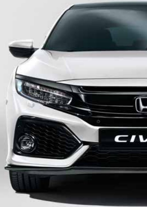
WHITE ORCHID PEARL