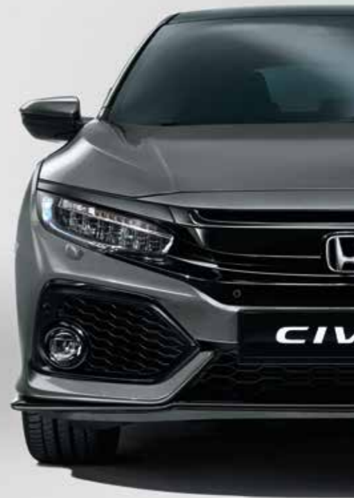
POLISHED METAL METALLIC