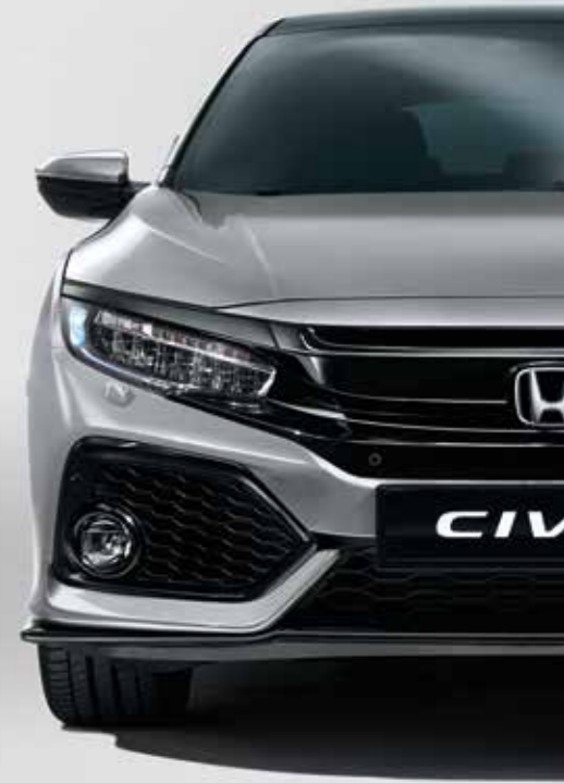
LUNAR SILVER METALLIC