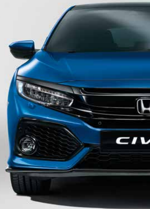
BRILLIANT SPORTY BLUE METALLIC