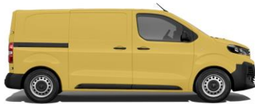
Ginster-Gelb, RAL 1032