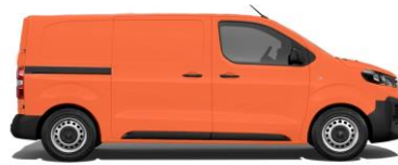
Kommunalorange, RAL 2011