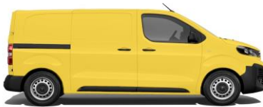
Verkehrsgelb, RAL 1023