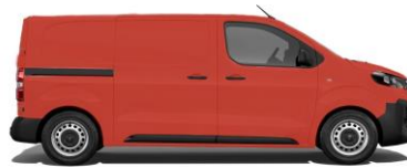
Feuer-Rot, RAL 3000