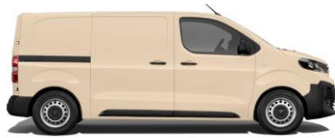
Hellelfenbein, RAL 1015