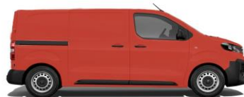
Feuer-Rot, RAL 3000