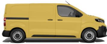
Ginster-Gelb, RAL 1032