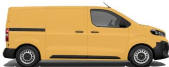
Gold-Gelb, RAL 1004