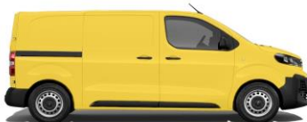
Verkehrsgelb, RAL 1023