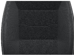
Premium Sitzbezug „Crepe Black“ schwarz mit Rückenlehnenmuster & Doppelte Seitennähte