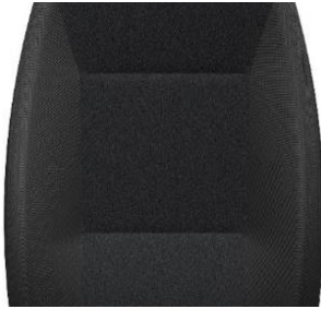
Standard Sitzbezug „Crepe Black“ schwarz