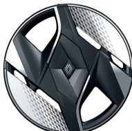
20" Leichtmetallräder „Oracle“