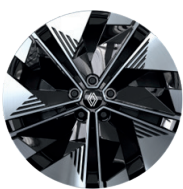
19" Leichtmetallräder „Streamline“