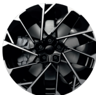
20" Leichtmetallräder „Speedway“