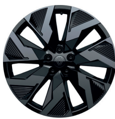
20" Leichtmetallfelgen „Castellet“, diamantgeschliffen