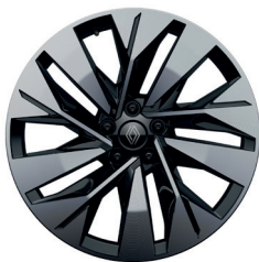
20" Leichtmetallfelgen „Sonic“, diamantgeschliffen