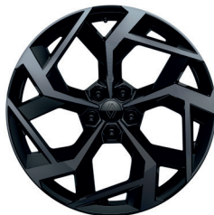
21" Leichtmetallfelgen „Chicane“, diamantgeschliffen