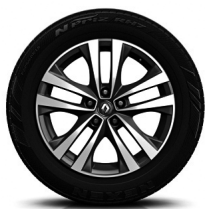
18-Zoll-Leichtmetallrad „Argonaute“, glanzgedreht