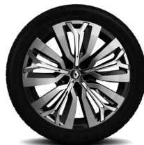
20-Zoll-Leichtmetallrad INITIALE PARIS, glanzgedreht