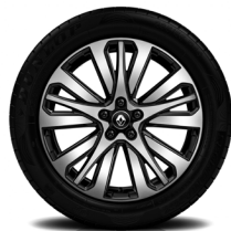
19-Zoll-Leichtmetallrad INITIALE PARIS, glanzgedreht